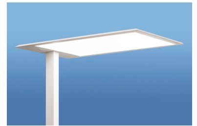
Leuchtenfarbe: Antrazit Eisenglimmer

Anschlussfertig mit wärmebeständigen Leitungen verdrahtet für den Netzbetrieb an 230V 50/60/0Hz